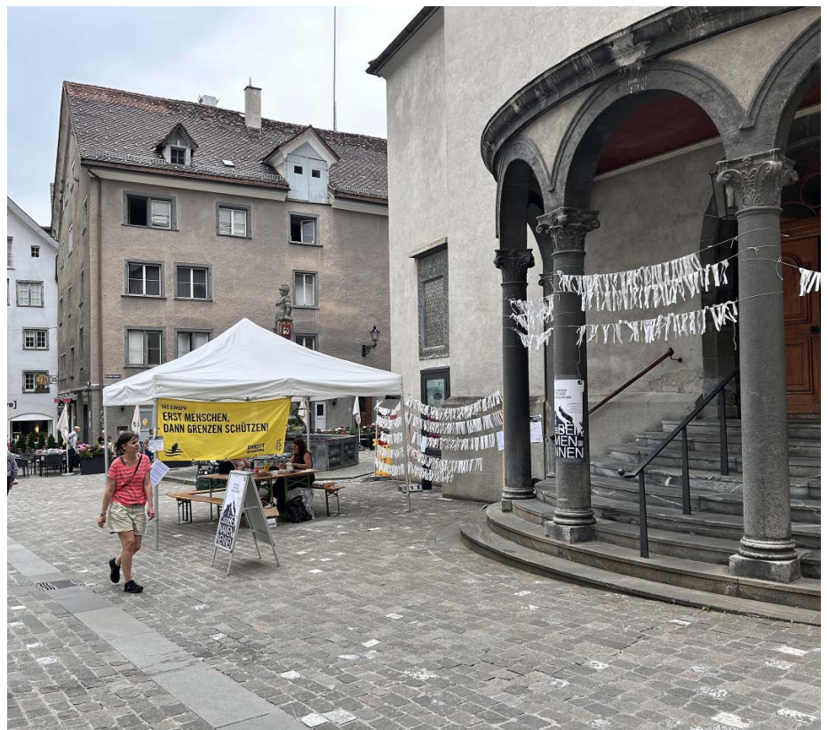
Die Fähnchen mit den Namen über dem Eingang der Martinskirche.

Am Freitag, 5. Juni, findet zudem im Kulturpunkt an der Planaterrastrasse 11 in Chur eine Tavolata, ein gemeinsames Essen mit Geflüchteten und Einheimischen, statt. Alle sind ab 18 Uhr eingeladen. Anschliessend treten geflüchtete Musikerinnen und Musiker aus der Ukraine, dem Iran und der Türkei an der Freitagabend-Bar im Kulturpunkt ab 19.30 Uhr auf. (pb)