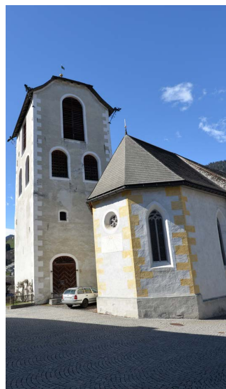
La baselgia Sontga Margareta a Glion ei stada liug principal per las dietas da 1524 e 1526.

La historia muossa a nus: las structuras dalla Baselgia semidan incuntin. Ella ei buca in baghetg static, plitost in plazzal nua che tuts astgan gidar a baghegiar. Mo nua che avunda personas s'engaschan en libertad e responsablidad, resta la Baselgia viva. Era ils proxims 500 onns!